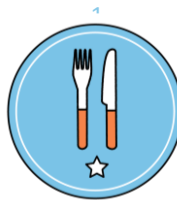
Mes & vork